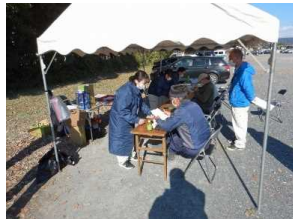
境界立会い会場の様子

会場（都田町沢上集落センター）にて、境界立会い書類に記名押印 (令和3年12月2日)